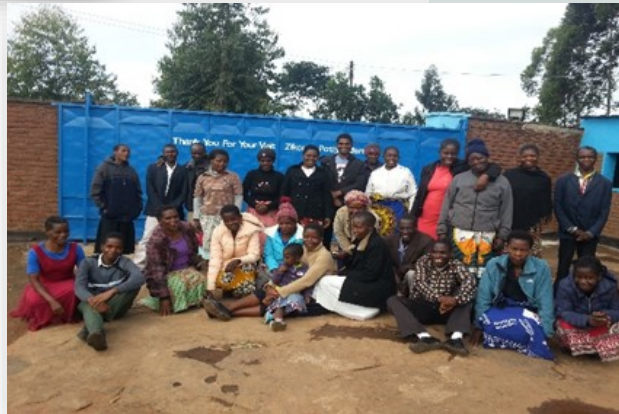
Groep jonge- ren in april begonnen met hun cursus