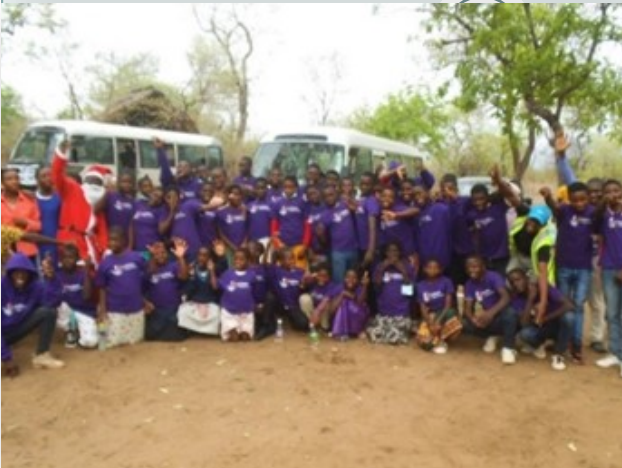
Jeugd op uitje in Majete Wild- park tijdens Kerst