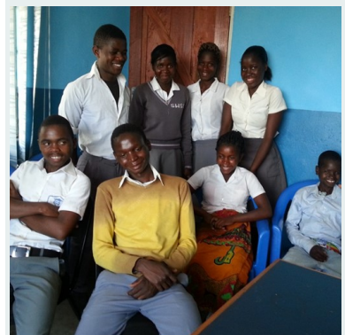
Jeugd luncht op centrum tijdens pauze